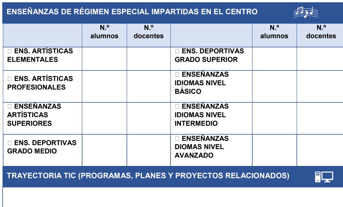
TABLA I. Datos básicos del centro educativo.